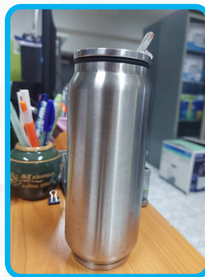
การลดการใช้พลาสติก